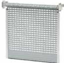
BKR / KNB