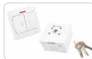
Przełączniki klawiszowe i kluczkowe