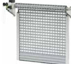
BKR / KNS