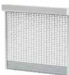
BKR / SK